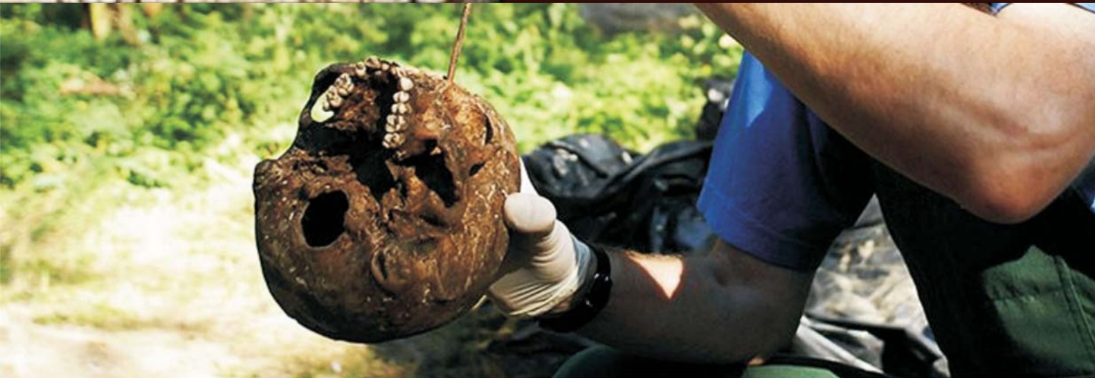
▲ Badania ekshumacyjne w Bykowni (ca. T. Puzos)