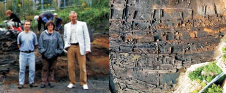
◀ Bydgoszcz, relikwiarz wału podczas badań w 2007 r.