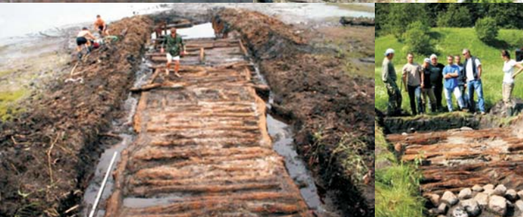
◀ Ekspedycja wykopaliskowa przy drewniano-kamiennym wale w Radaczu na Pomorzu Środkowym (badania 2009 rok)

Konferencja pt. Człowiek i środowisko przyrodnicze we wczesnym średniowieczu w świetle badań interdyscyplinarnych, zorganizowana w 2004 roku w Instytucie Archeologii UMK. Zorganizowanie cyklu wykładów pod wspólnym tytułem Civitas Schinesghe cum pertinentiis, na który zaproszono ważniejszych badaczy zajmujących się problematyką wczesnego średniowiecza w Polsce.