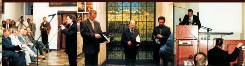
▲ Wystawa w Toruniu – Ratusz Staromiejski, październik 2003 r. (il. P. Bonda)