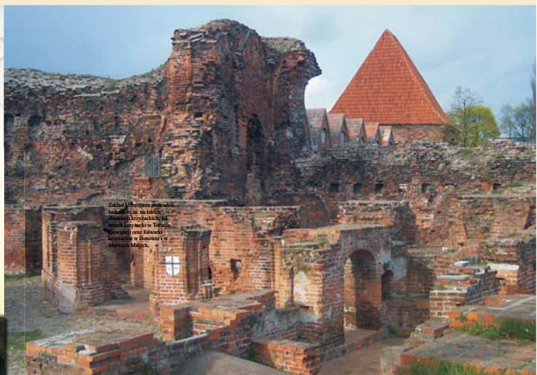
Zakład Historii Uzbrojenia prowadzi badania m.in. na takich obiektach krzyżackich, jak zamek krzyżacki w Toruniu (powyżej) oraz folwark krzyżackie w Benowie i w Mątwach Małych.