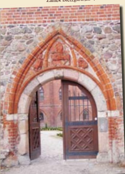
Zamek Bierzgłowski ▼