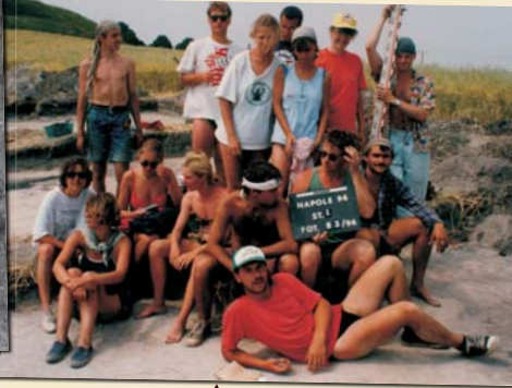
Napole, grodzisko. Ekipa badawcza z 1994 roku. (za M. Skowronską i J. Bujarski)