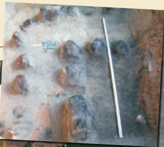
« Pięt, gródka na stoku. Warownia prokuratora krzyżackiego. Pozostałości spalonego obiektu mieszkalno-obronowego: narożnik północno-wschodni. (za A. Janowskiego)