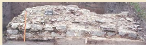
▲ Kaldus, grodzisko, stan. 3 - relikty murowanej bazyliki. (za W. Chudziaka)

Temat realizowany latach 1995-1997 w ramach szerszego programu Adalbertus finansowanego przez Fundację na Rzecz Nauki Polskiej. Szczególny nacisk położono na rekonstrukcję przebiegu szlaku łączącego ziemię chełmińską z ziemiami pruskimi, w tym celu rozpoznano wykopaliskowo wybrane najważniejsze jego ogniewa w postaci grodzisk zlokalizowanych w Chelmży, Wieldządzu, Szymwałdzie i Klaszorku. Dodatkowo przeprowadzono szczegółowe rozpoznanie powierzchniowe, uzupełnione o badania przyrodnicze. Efektem tych prac była wspólna publikacja pracowników ZAWSZCZ-Ń pt. Wczesnośredniowieczny szlak lądowy z Kujawy do Prus (XI wiek). Studia i materiały , pod red. W. Chudziaka (Toruń 1997).