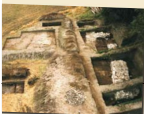
▲ Kaldus, cmentarzysko - grób komorowy. (za W. Chudziaka)