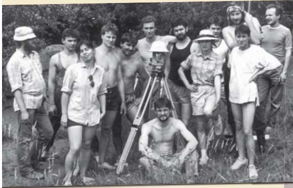
Gronowo, skład ekipy badawczej w roku 1989