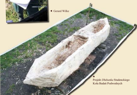
▲ Projekt Dębanka Studenckiego Koła Badań Podwodnych