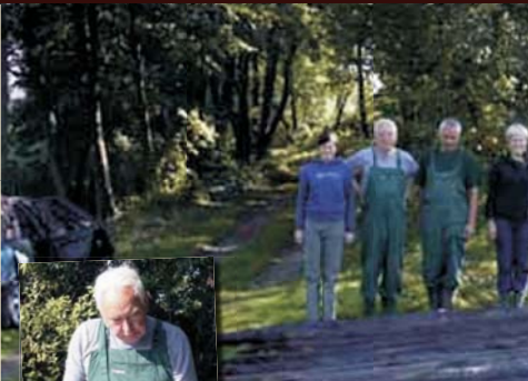
▲ Nętno - pow. Drawsko Pomorskie, woj. zachodniopomorskie, Jezioro Gagnowskie (relikty mostu z X/XI w.), badania w latach 2003/2004 i 2006/2007