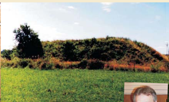
Mołtajny - pow. Kętrzyn, woj. warmińsko-mazurskie, Jezioro Arkiłkie (relikty osiedla nawodnego z wczesnej epoki żelaza); badania w latach 1986-1991.