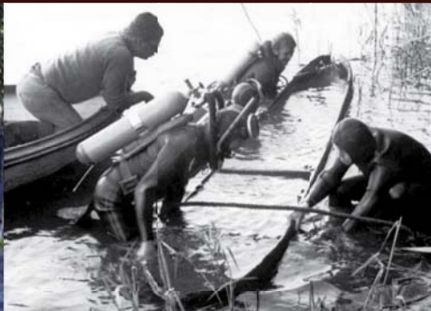
▲ Wydobywanie dębaki z Jeziora Lednickiego.