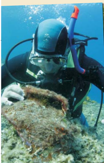
Naczynie odkryte w obrębie antycznego portu w Zaton. Student archeologii w czasie penetracji podwodnych przy wyspie Silba.