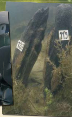
Ostrow Lednicki, woj. wielkopolskie. Badania (w latach 1977-1989, 1991-1992, 1994, 1999-2007) relikwów mostów wczesnośredniowiecznych.