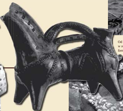
Mogilno – Unikatowe znalezisko – akwamania.